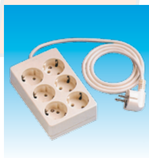
2FA2516 BASE 6T.TTL.SUP.C/ C.CUADRADA FAMAT.2516