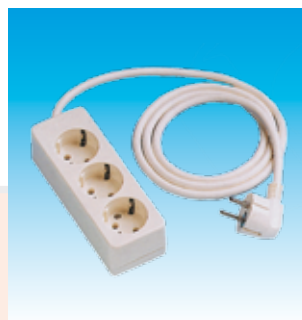
2FA2513 BASE 3T.TTL.SUP.C/ C.FAMAT.2513