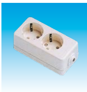
2FA2502 BASE 2T.TTL.SUPERFICIE FAMA- TEL 2502