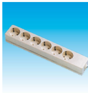
2FA2507 BASE 6T.TTL.SUP.LINEAL FA- MAT.2507