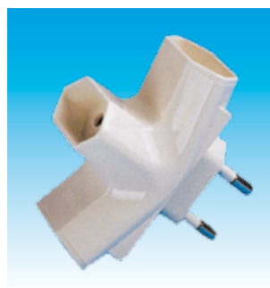
2FA1217 MULTIPLI. TRIPLE NORMAL FAMA- TEL 1217