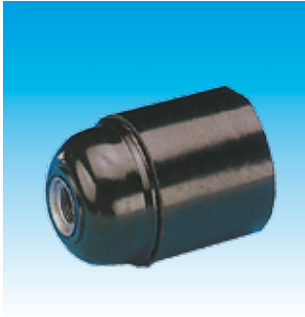
2FA161 PORTALAMPARAS FAMATEL 161 NEGRO E-27