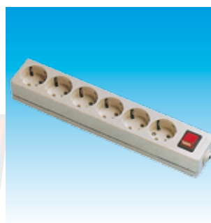
2FA2508 BASE 6T.TTL.SUP.C/I.LINEAL FA2508