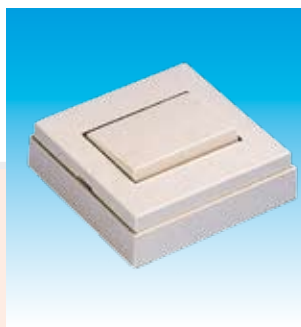
2FA5001 INT.SUPERFICIE FAMATEL 5001