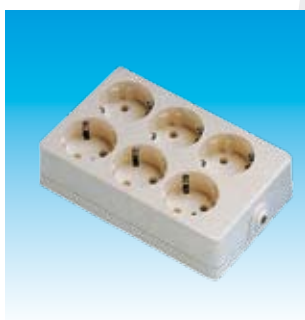
2FA2506 BASE 6T.TTL.SUP.CUADRADA FAMAT.2506