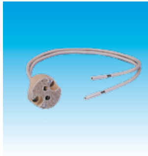
2FA481 P/LAMP DICROICA CON CABLE FAMATEL 481