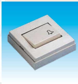
2FA5010 PULSADOR TIMBRE SUPERF. FAMATEL 5010