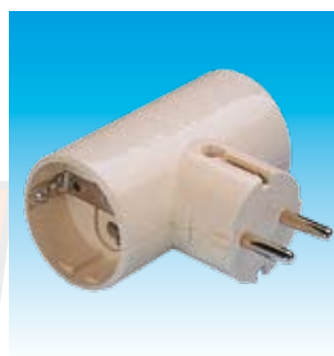
2FA1302 MULTIPLICADOR DOBLE T.T. FAMATEL 1302