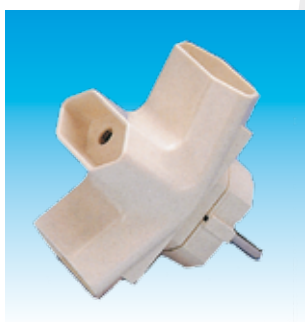
2FA1206 TRIPLE PILOTO FAMATEL 1206