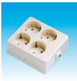
2FA2504 BASE 4T.TTL.SUP.CUADRADA FAMT.2504