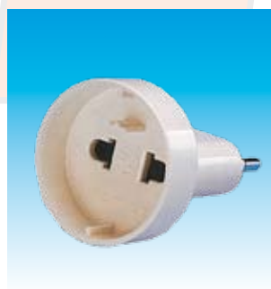
2FA1403 ADAPTADOR EUROPEO UNIVER- SAL FA.1403