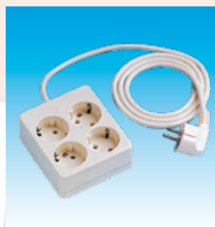
2FA2514 BASE 4T.TTL.SUP.C/ C.CUADRADA FAMAT.2514