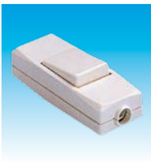
2FA4402 INTERRUPTOR PASO FAMATEL 4402 BLANCO