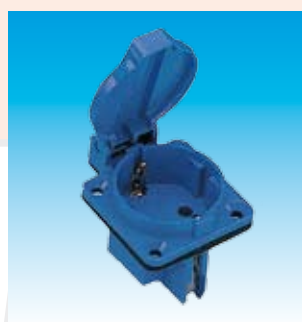
2FA13950 BASE SCHUCO TTL CUADRO 13950 FAMATEL