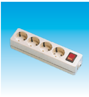
2FA2528 BASE 4T.TTL.SUPC/I.LINEAL FAMAT.2528