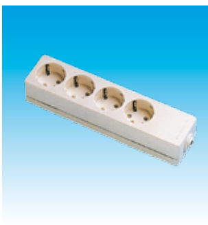
2FA2524 BASE 4T.TTL.SUP.LINEAL FA- MAT.2524