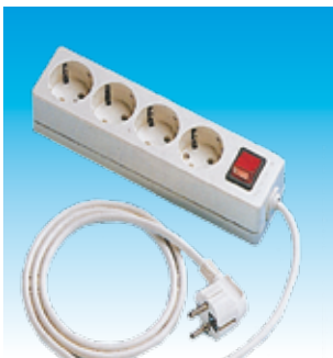
2FA2628 BASE 4T.TTL.SUPC/C+I LINEAL FA2628