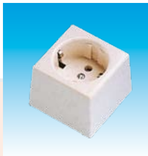
2FA2301 BASE TTL SUPERFICIE PORCELA- NA 2301