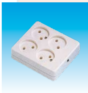
2FA2404 BASE 4T.BP.SUP.CUADRADA FAMAT.2404