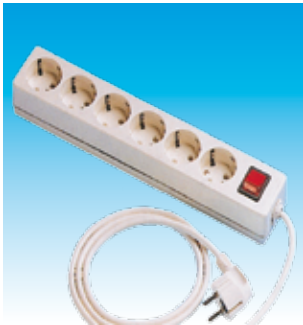
2FA2518 BASE 6T.TTL.SUPC/C+I.LINEAL FAMAT.2518