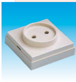
2FA5024 BASE SUPERFICIE NORMAL FAMATEL 5024 BIP.