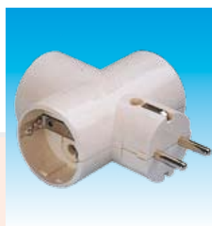
2FA1303 MULTIPLICADOR TRIPLE T.T. FAMATEL 1303