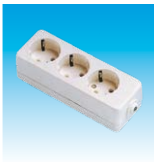
2FA2503 BASE 3T.TTL.SUPERFICIE FAMA- TEL 2503