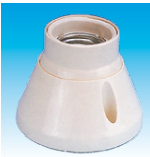
2FA181 P/LAMP.ZOCALO PORCELANA FAMATEL 181