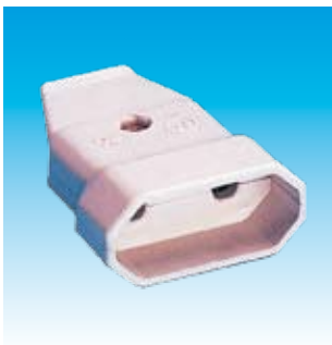
2FA2002 BASE AEREA 2002 2P FAMATEL