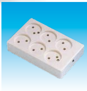
2FA2406 BASE 6T.BP.SUP.CUADRADA FAMAT.2406