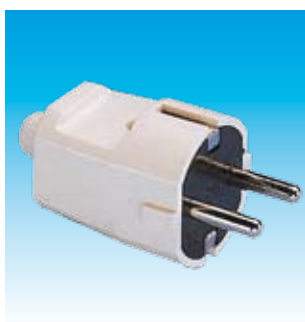
2FA1001N CLAVIJA IIP NORMAL FAMATEL 1001-N