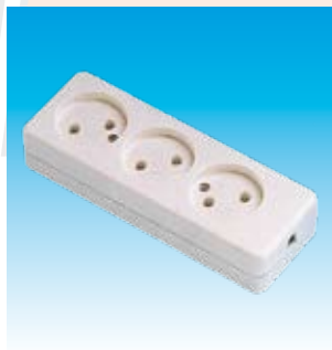
2FA2403 BASE 3T.BP. SUPERFICIE FAMATEL 2403