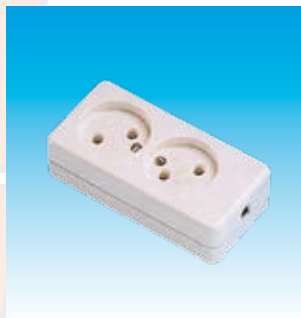
2FA2402 BASE 2T. BPSUPERFICIE FAMATEL 2402