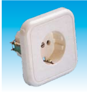
2FA2300 BASE SCHUCO EMP.FAMATEL 2300