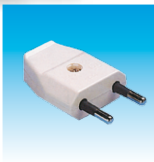
2FA1001B CLAVIJA IIP NORMAL FAMATEL 1001 B