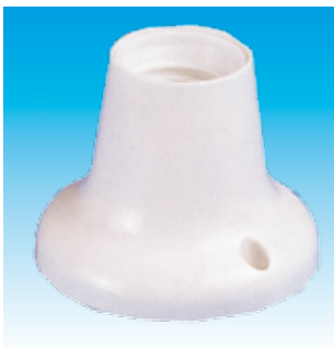
2FA171 P/LAMP. E 27 BAQUELITA FAMA- TEL 171