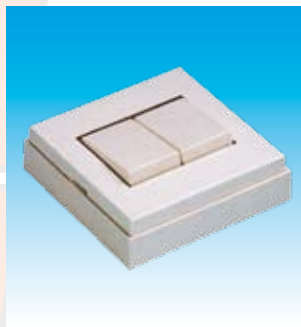
2FA5003 INT.DOBLE DE SUPERFICIE FAMATEL 5003