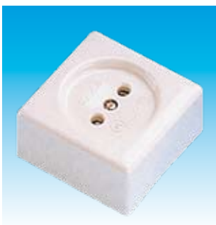
2FA2201 BASE SUPERFICIE IIP:2201